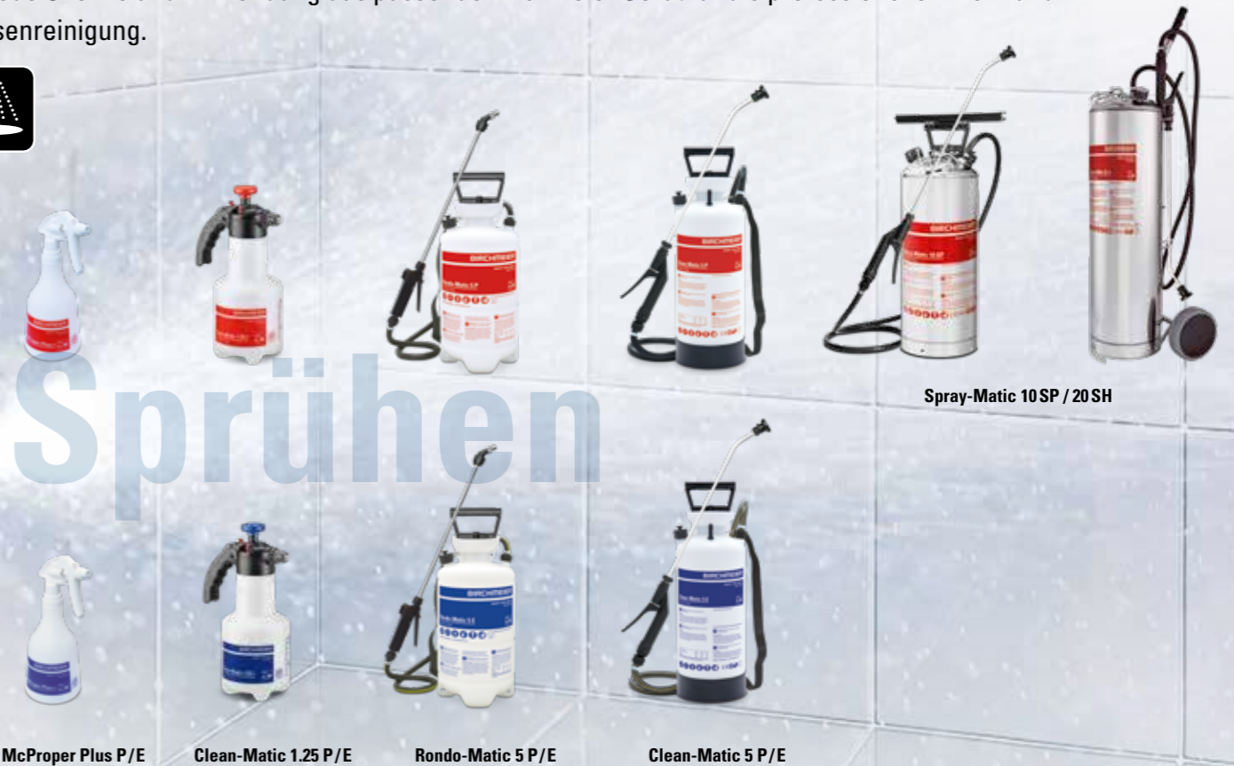
Spray-Matic 10 SP / 20 SH