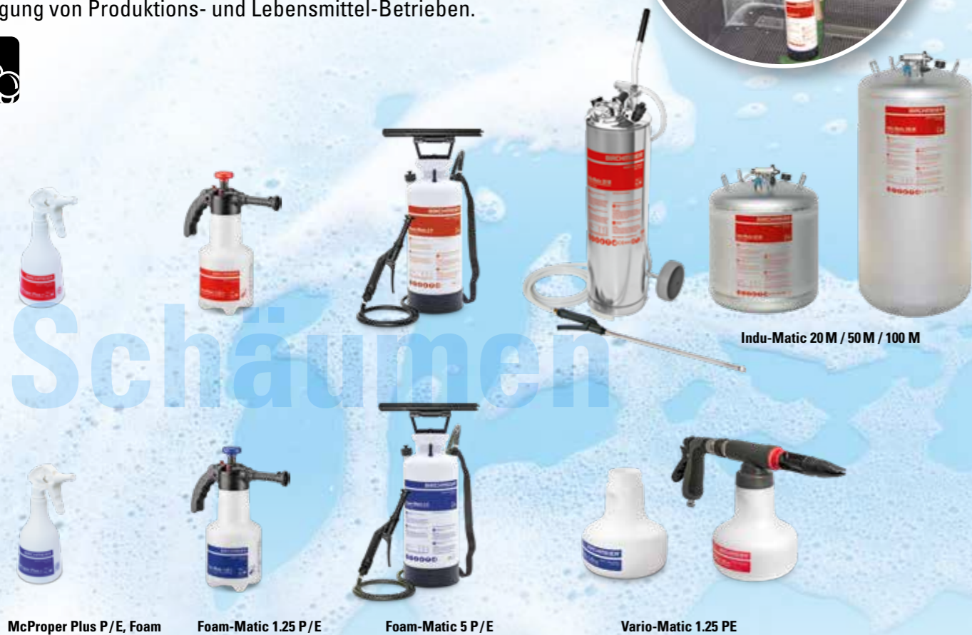
Indu-Matic 20 M / 50 M / 100 M