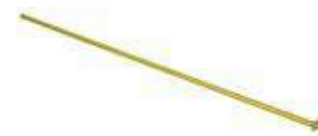
Teleskoprohr 1-2 m Art.Nr. 10985201