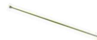
Verlängerung 1 m Art.Nr. 10960601