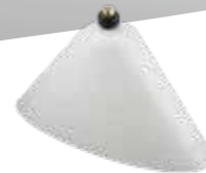
Sprühschirm oval, weiss Art.Nr. 10501606