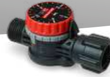
Einstellbares Druckregelventil PR 3 P1 Art.Nr. 12140001