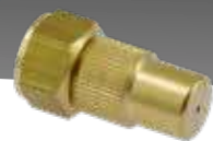
Regulierdüsen 1.3 mm und 1.7 mm Art.Nr. 28502598-SB, Art.Nr. 28502597-SB

Bewährtes Messing Handventil mit neuer Feststell- und Sperrfunktion.