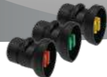
Flachstrahldüse (XR 8001 VS – XR 8008 VS) Art.Nr. 11612801-SB – 11612808-SB