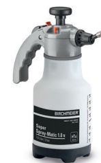
Super Spray-Matic 1.0 N (BMS 2010) Art.Nr. 12152101