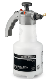
Spray-Matic 1.25 N (PA) / 360° Art.Nr. 11963301