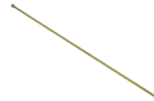
Prolunga da 1 m diritta in ottone, G1/4" a-G1/4"i N. art. 10960601