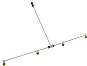
Barra di nebulizzazione in alluminio max 12 bar, avvitabile N. art. 11889501-SB