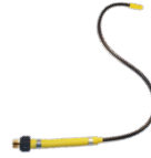
Mini-Flex No. d'art. 11947101