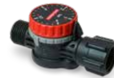
Einstellbares Druckregelventil PR 3