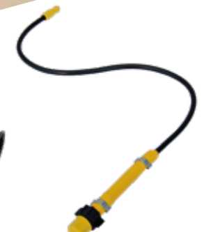
Mini-Flex: Die flexible Verlängerung zum Stäuben und Sprühen