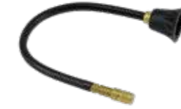
Verlängerungsrohr 26 cm biegbar für Super Star 1.25