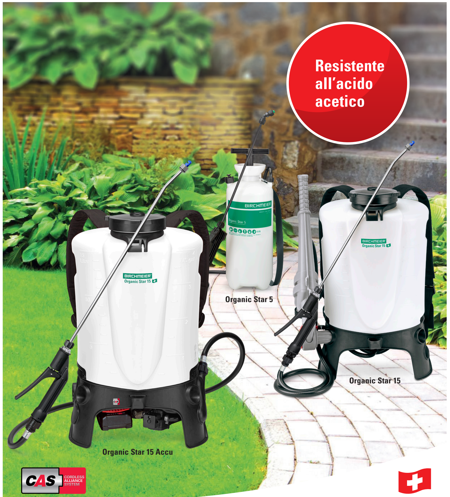
Organic Star 5