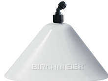
Sprühschirm oval, steckbar Art.Nr. 11871101