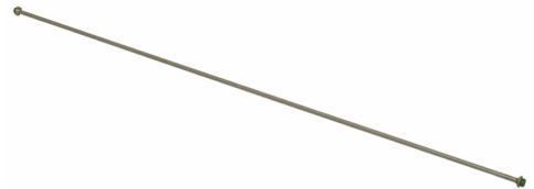
Tubo 1 m diritta, acciaio inossidabile, G1/4" a-G1/4" a N. art. 11669802