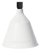
Campana rotonda, 12.5 cm, avvitabile N. art. 11998601