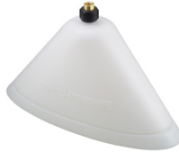
Campana professionale, ovale, avvitabile N. art. 10501606