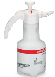
Food-Matic 1.25 P mit Regulierdüse Art.Nr. 11990801