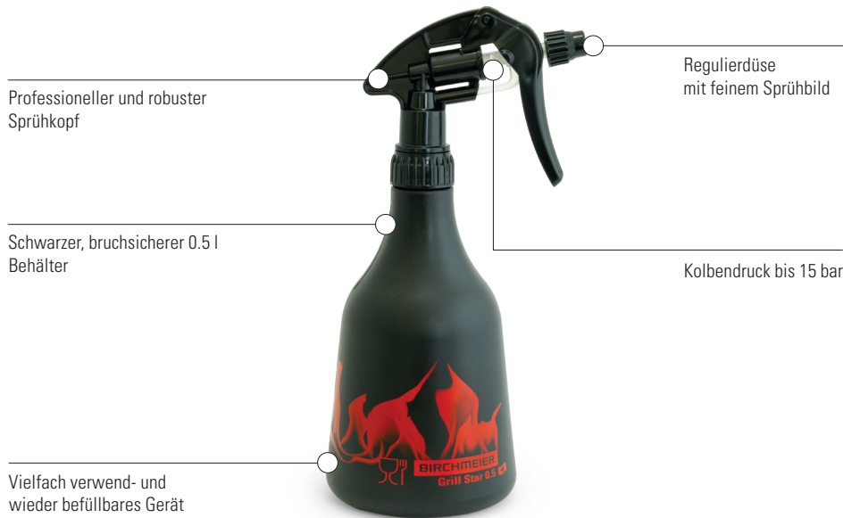
Grill Star 0.5 Art.Nr. 12168801

Desk Display (15 Stück) Grill Star 0.5 Art.Nr. 12091001