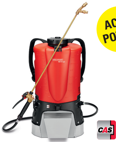
REX 15 AC1